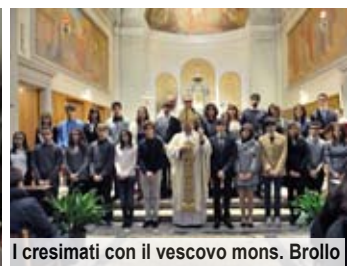
I cresimati con il vescovo mons. Brollo