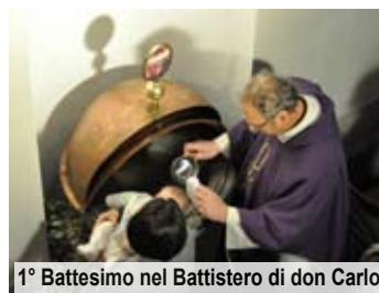
1° Battesimo nel Battistero di don Carlo