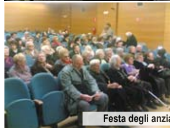
Festa degli anziani in Sala Comelli