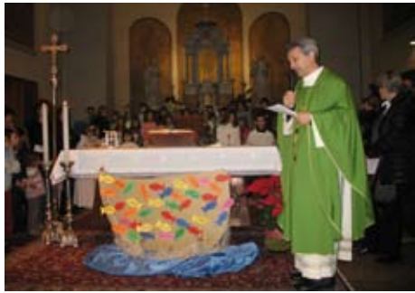
Celebrazione iniziale del 25 gennaio 2009