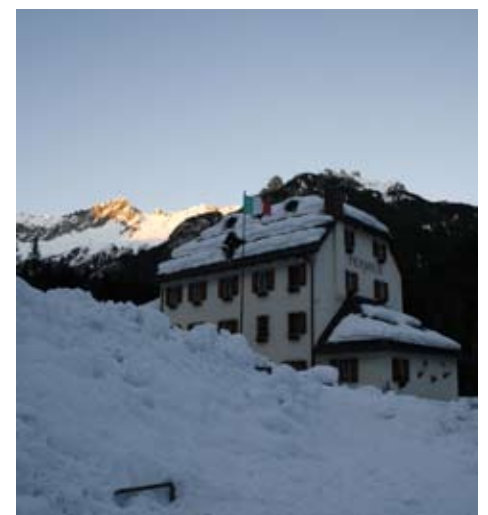
La casa di Pierabech immersa nella neve