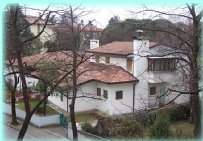
La scuola dell'infanzia di San Marco oggi