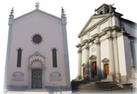
Le chiese parrocchiali di San Marco e Sant'Andrea di Paderno

figura fondamentale dell'esperienza cristiana. Un cammino che vuole essere esperienza di comunione. Proprio per questo il culmine di questo cammino sarà la celebrazione del "miracolo della riconciliazione", cioè la confessione comunitaria in preparazione alla Pasqua che vivremo sempre insieme lunedì 6 aprile nella chiesa di Sant'Andrea a Paderno.