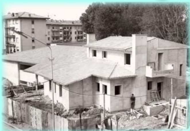
La scuola dell'infanzia in costruzione nell'anno 1968