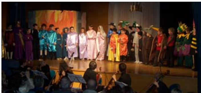
I piccoli attori dell'Associazione Teatrando durante la recita di "I piccoli, grandi cavalieri"

Prosegue con successo in Sala Comelli la 6 a Rassegna Teatrale per la famiglia "Teatrolandia". Dopo le prime due rappresentazioni proposte dall'Associazione Culturale Teatrando "I piccoli, grandi cavalieri" e "Signore e signori, sull'Olimpo si fa cabaret" per la regia di Paola Carlesso, la manifestazione si concluderà nel mese di febbraio con i seguenti lavori: